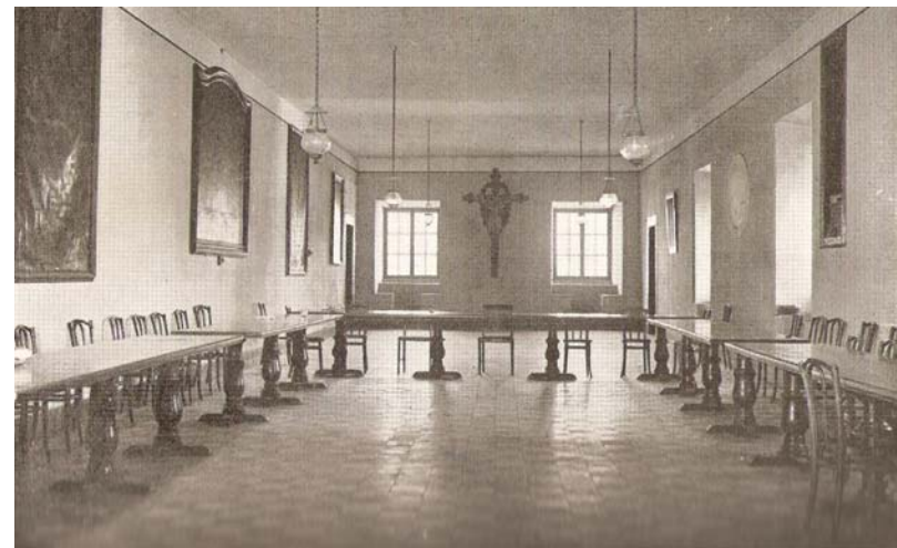
Refeitório do Convento em foto de 1937

O Convento de Santo Antônio, num gesto inédito em sua história de 400 anos, abriu, no dia 25 de setembro, seu refeitório para uma ceia muito especial: recebeu 140 convidados, entre os quais alguns dos maiores empresários brasileiros. De alguma forma foi um contrabalanço à ceia oferecida a 400 pobres no dia 5 de junho último, no claustro do Convento. Encabeçaram o evento a Fraternidade local, as duas estatais, que patrocinam as obras de restauro e revitalização do Complexo Arquitetônico do Convento Santo Antônio, BNDES e PETROBRAS, com o apoio e a criatividade do Grupo ABC do publicitário e empresário Nizan Guanães.